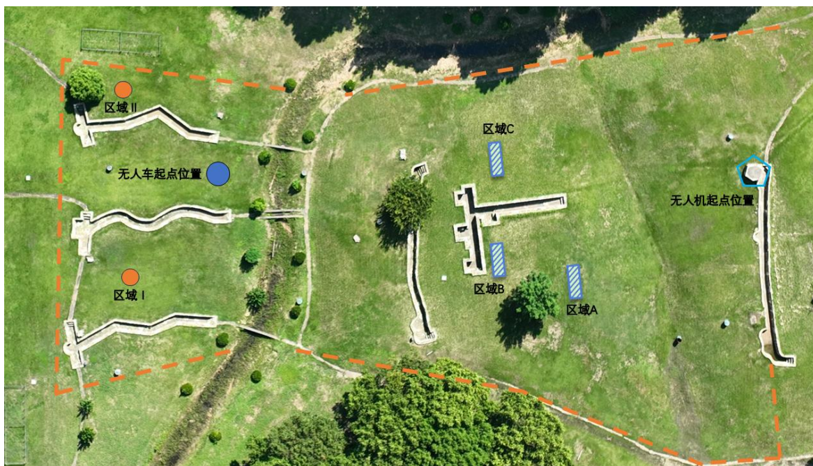
图2 陆空联合保障运输赛场地图